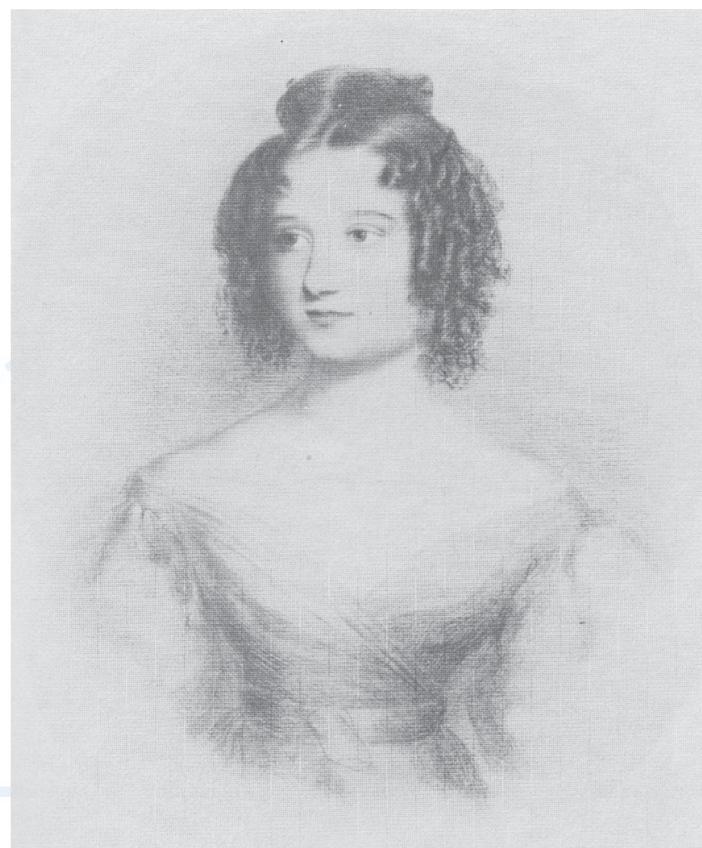
Ada Byron, 17 år, 1832

Ada Lovelace møtte professor Charles Babbage i juni 1833 gjennom deres felles venn Mary Somerville. Senere samme måned inviterte Babbage henne til å se prototypen for hans første mekaniske regnemaskin, differansmaskinen ( The Difference Engine ). Denne maskinen var ment å fremstille logaritmetabeller, der beregningen ble approksimert med differansemetoden. Babbage fikk bevilget støtte av den britiske regjeringen for å lage differansmaskinen, men var ikke i stand til å konstruere den.