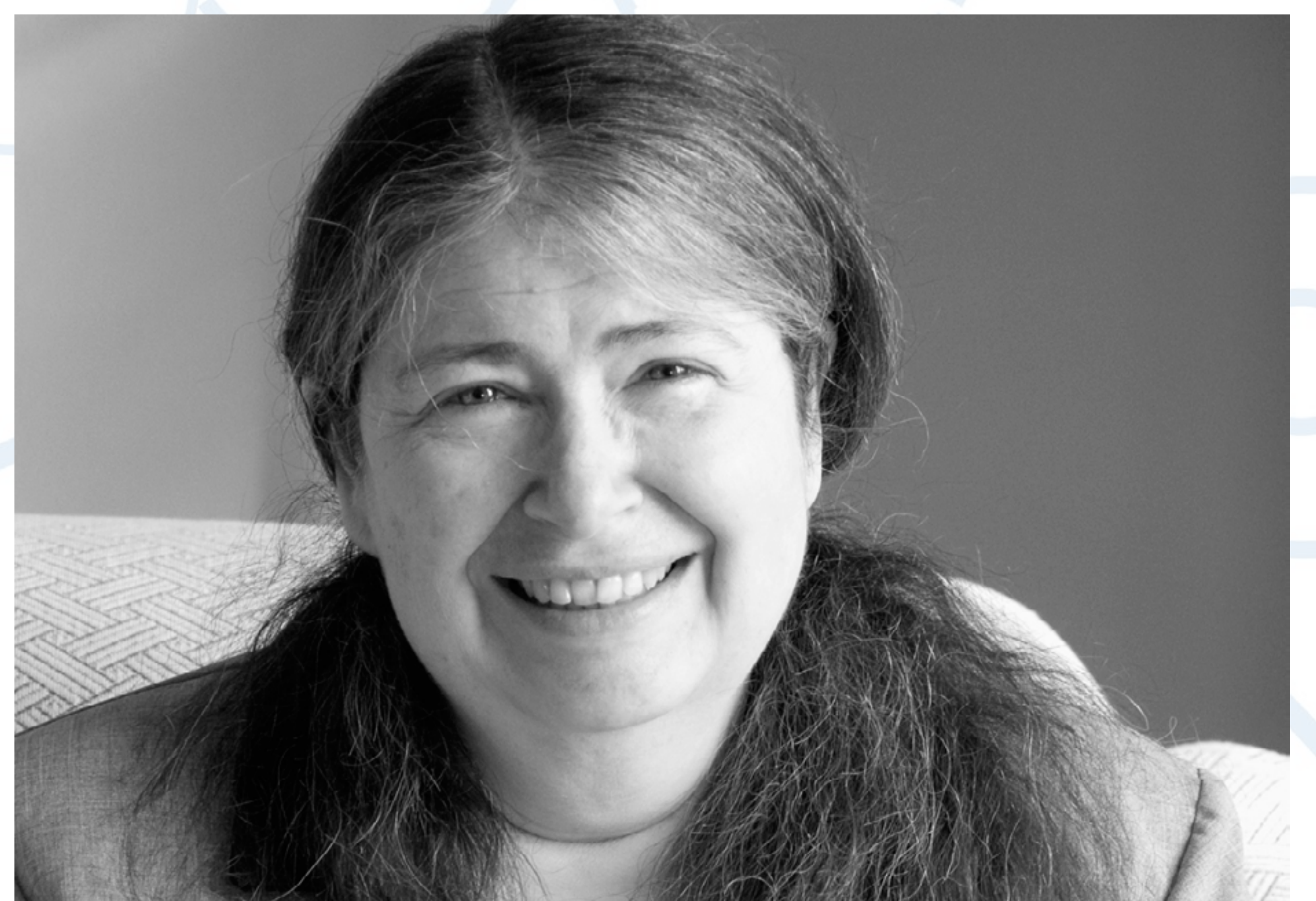
Radia Perlman er oppfinner av algoritmen “The Spanning Tree Protocol”

Perlman oppnådde en mastergrad i matematikk fra MIT i 1976, og jobbet med å løse oppgaven om hvordan man kunne få data-maskiner til å dele informasjon på en pålitelig måte. Hennes svar var the Spanning Tree Protocol (STP), en algoritme som unngår risikoen for løkker i et nettverk. Dette ble en del av standardene til grunn for driften av internett, og avgjørende for dets robusthet og skalerbarhet. Hun gjorde også store bidrag til mange andre områder av nettverkdesign og standardisering.