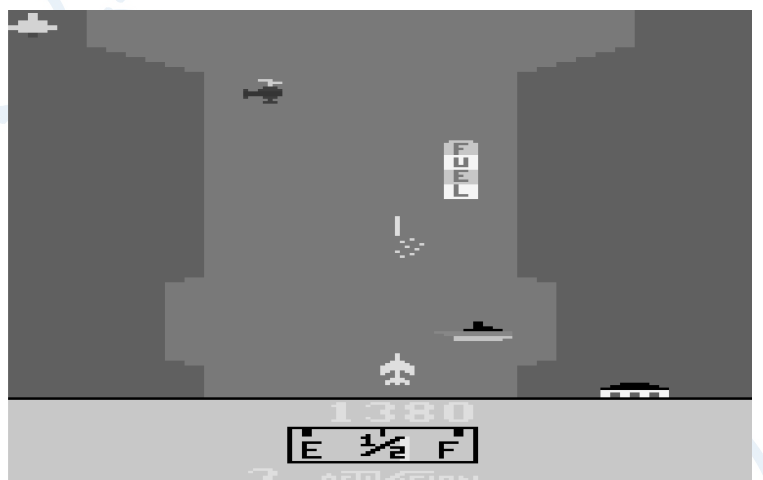
Skjerm bilde av spillet River Raid