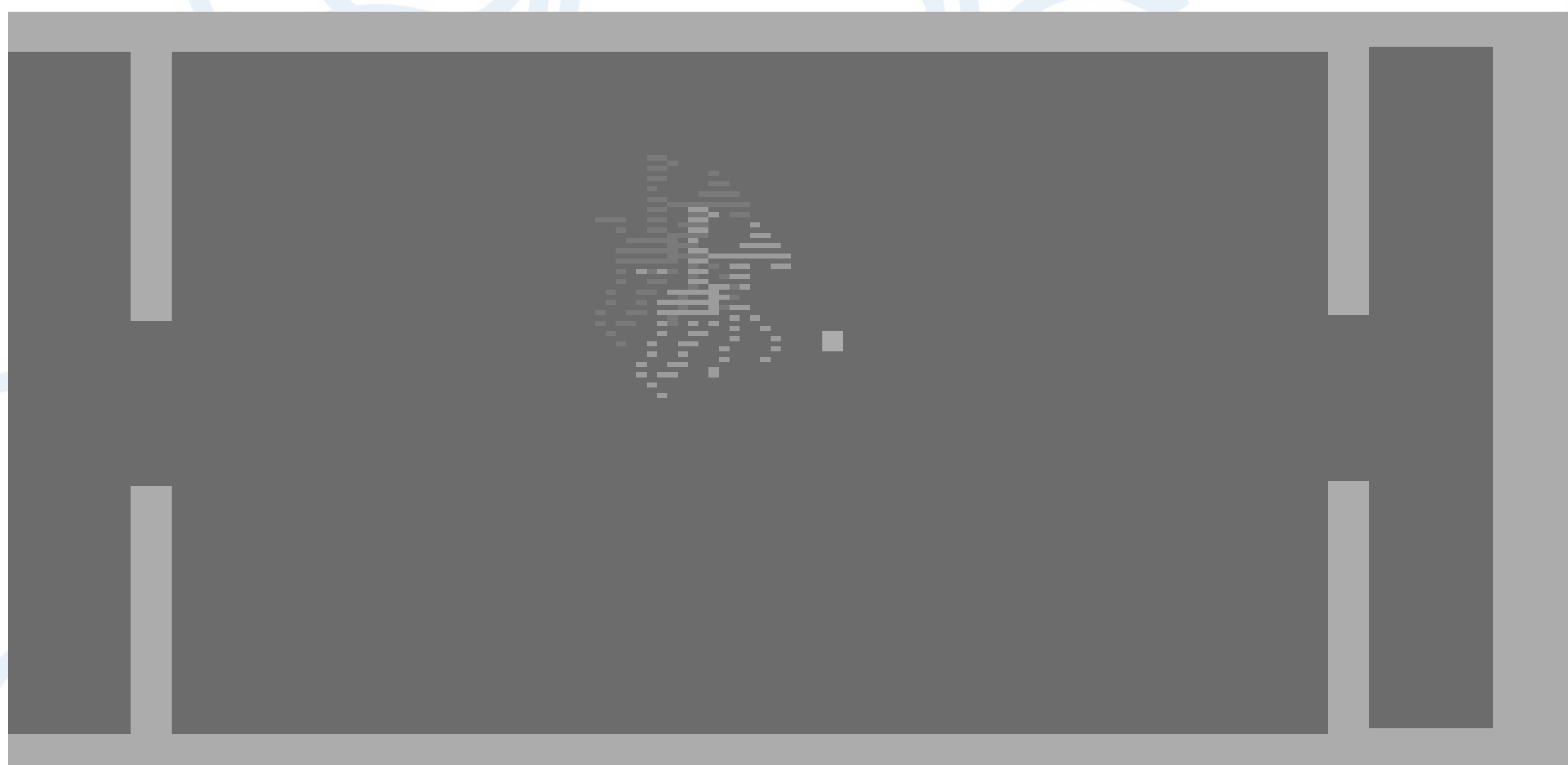
Skjerm bilde av spillprototypen Polo